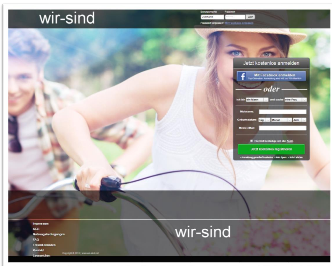
Abbildung 4: Screenshot der Startseite von wir-sind.net; hier sind zwar zwei Menschen abgebildet und die Anmeldung lässt darauf schließen, dass man echte Personen kennenlernen kann, allerdings gibt es keine Profilbilder.

Portale, die in ihren AGB angeben mit fiktiven Profilen zu arbeiten, und auf der Startseite keine echten Kontakte versprechen.